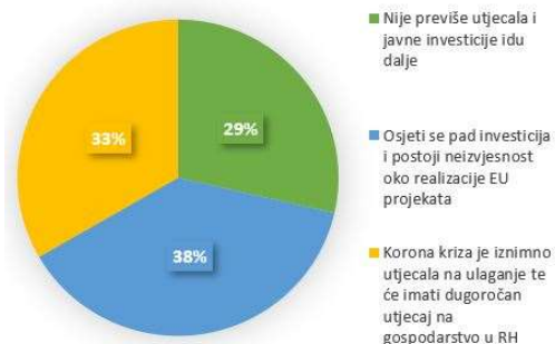
Koliko je korona kriza utjecala na ulaganja u infrastrukturu?