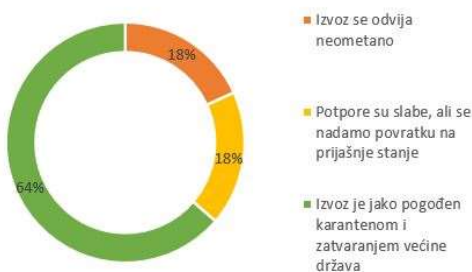
Kako ocjenjujete izvozna kretanja u vrijeme pandemije Covida-19?